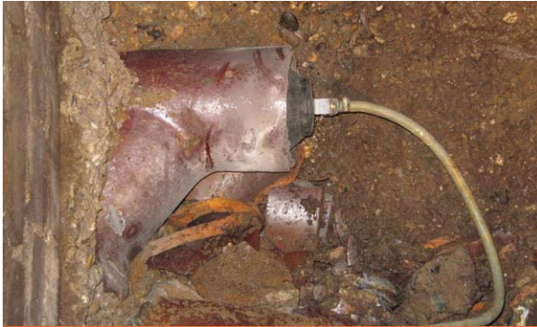
Absperrröhre zur Dichtheitsprüfung