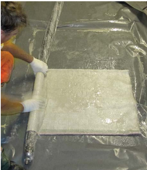
Vorbereitung eines Kurzliners

Voraussetzung für das Liningverfahren ist, dass die ursprüngliche Querschnittsform des Altrohres noch erhalten ist (keine Deformationen oder Einbrüche). Die Erreichung der erforderlichen Materialeigenschaften und der Wasserdichtheit kann anhand von Proben nachgewiesen werden. An Kleinstproben kann man die ordnungsgemäße Aushärtung kontrollieren.