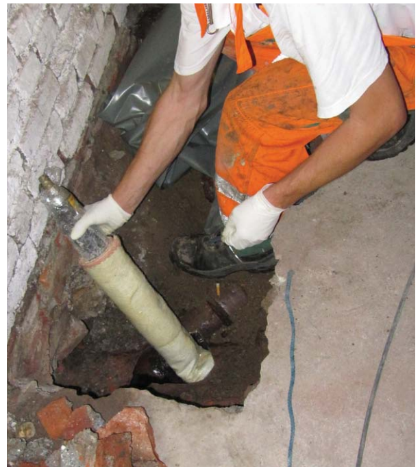
Einführung des Kurzliners in die defekte Leitung