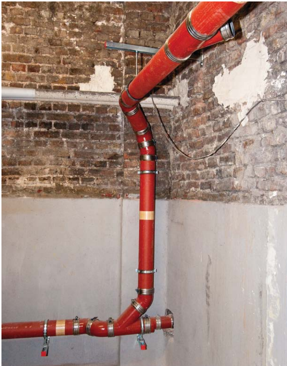
Abgehängte Leitungen an der Kellerwand

Sofern ein Keller vorhanden ist, besteht vielfach die Möglichkeit, die im Kellerbereich vorhandenen Ablaufstellen wie Waschbecken oder Bodeneinläufe aufzugeben und die vom Erdgeschoss kommenden Fallleitungen an der Kellerdecke abzufangen und hoch liegend nach außen zu führen. Das Abwasser einzelner Ablaufstellen im Kellerbereich kann mit einer Pumpe in diese Leitungen gehoben werden.