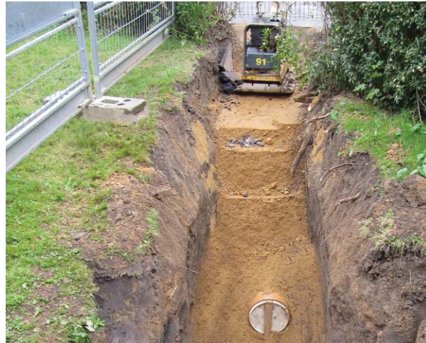
Erneuerung im offenen Graben

Auch bei Abwasserleitungen im Straßenbereich sollte wegen des Aufwandes auf Alternativen, wie z. B. das Liningverfahren zurückgegriffen werden.