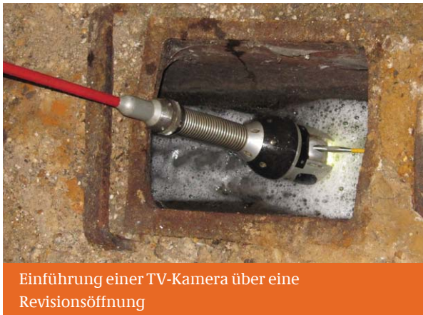
Einführung einer TV-Kamera über eine Revisionsöffnung

Die Ergebnisse der Inspektion sind durch die Prüffirma entsprechend dem geltenden Regelwerk in textlicher Beschreibung und auf Video festzuhalten.