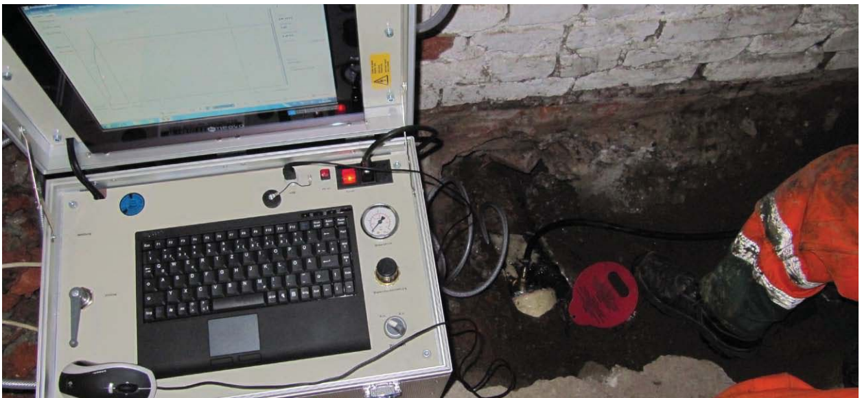
Druckverlustmessung bei der Dichtheitsprüfung mit Luftdruck