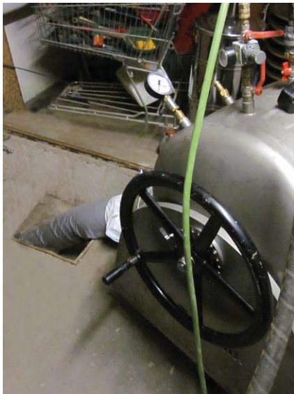
Einbautrommel für das Liningverfahren