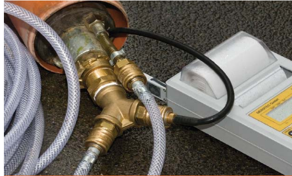
Gerät zur Dichtheitsprüfung mit Luftdruck