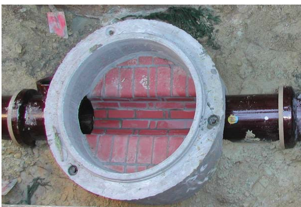
Einbau eines Revisionsschachtes

Keinesfalls sollten Sie sich von einer Firma zu einer sofortigen Dichtheitsprüfung oder Sanierung überreden lassen. Vermeiden Sie Geschäfte an der Haustür! Planen Sie in Ruhe die erforderlichen Arbeiten, holen Sie sich unabhängigen Rat ein und fragen mehrere Firmen an, um vergleichen zu können. Die Dichtheitsprüfung und die Sanierung sollten grundsätzlich von verschiedenen Firmen durchgeführt werden. Einige Städte und Gemeinden geben dabei Hilfestellung und stellen auch Vertragsmuster zur Verfügung. Soweit Sie selbst nicht fachkundig sind, sollten Sie für die Planung und Überwachung der Arbeiten ein unabhängiges Ingenieurbüro für Grundstücksentwässerung hinzuziehen.