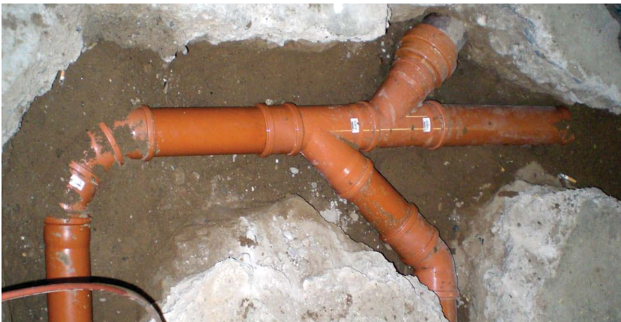
Aufwändige Erneuerung von Abwasserleitungen unter der Bodenplatte

Leitungsgräben müssen in Abhängigkeit der Tiefe und des anstehenden Bodens durch einen Verbau gesichert werden. Im Gebäudebereich ist außerdem darauf zu achten, dass die Standsicherheit des Gebäudes bei Aushubarbeiten nicht gefährdet wird.