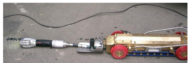
Beispiel einer TV- Kamera

Bei gewerblichem Schmutzwasser, in Wasserschutzgebieten sowie in Gebieten, wo Grund- und Sickerwasser aus dem Boden in undichte Leitungen dringt (Fremdwasser), kann auch bei bestehenden Leitungen eine Prüfung mit Wasser- oder Luftdruck erforderlich sein. Darüber hinaus muss eine Prüfung mit Wasser oder Luft durchgeführt werden, wenn eine TV-Inspektion nicht möglich ist.