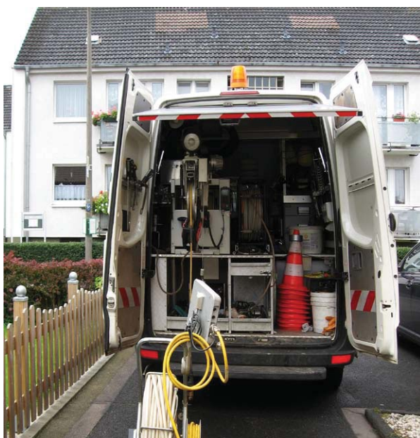
TV-Inspektionsfahrzeug im Einsatz

Nur die Leitungen, die im Erdreich (auch unterhalb des Gebäudes) oder unzugänglich verlegt sind, müssen regelmäßig überprüft werden. Leitungen innerhalb des Gebäudes unterliegen dieser Prüfpflicht nicht, weil hier austretendes Abwasser direkt bemerkt wird. Das gleiche gilt für Leitungen in Schutzrohren, wenn ein Abwasseraustritt festgestellt werden kann.