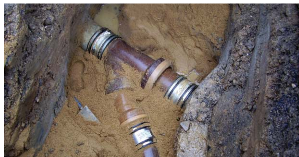
Reparatur einer Leitung in offener Baugrube

Bei größeren Tiefen und vor allem bei aufwändig gestalteter oder überbauter Oberfläche steigen die Kosten für offene Baugruben stark an. Vor allem bei Leitungen unter der Bodenplatte sollten Alternativen, insbesondere die zugängliche Installation (siehe 4.4.5) geprüft werden.