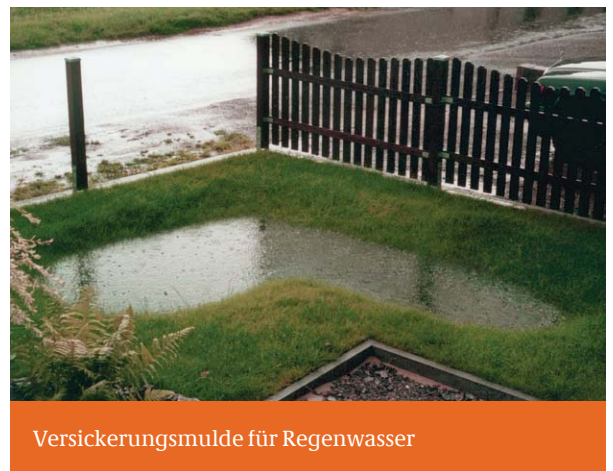
Versickerungsmulde für Regenwasser

Zu beachten ist, dass auch undichte Leitungen eine dränierende Wirkung haben können. Deshalb kann es nach einer Leitungsabdichtung durch dann steigende Grundwasserspiegel zu Gebäudevernässungen kommen. Das mögliche Risiko sollte durch einen Fachmann beurteilt werden.