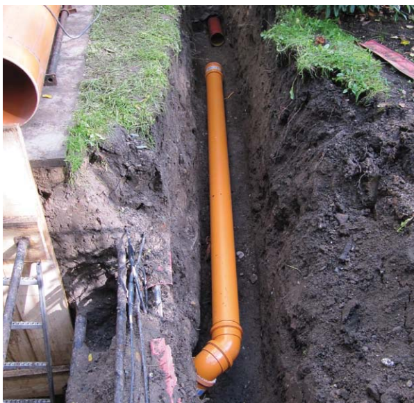
Erneuerung einer Abwasserleitung

Inwieweit Sie für die Sanierung der Abwasserleitung vom Revisionsschacht bzw. der Grundstücksgrenze bis zum öffentlichen