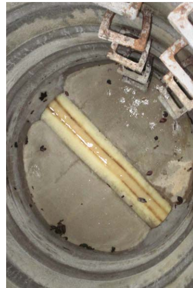
Linerdurchführung im Schacht